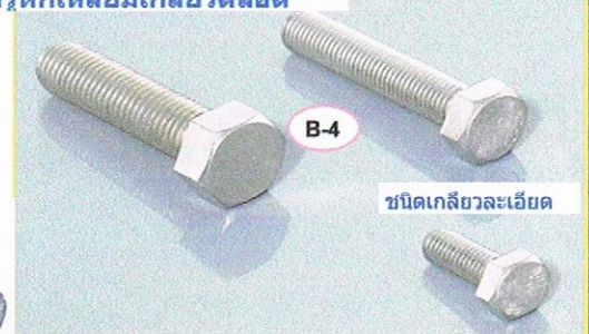
ชนิดเกลียวละเอียด