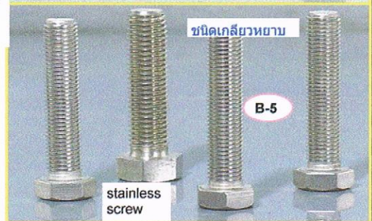
ชนิดเกลียวหยาบ